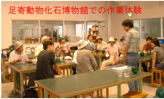
足寄動物化石博物館での作業体験