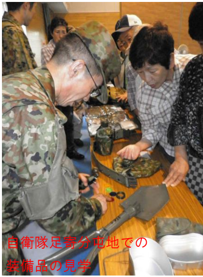
自衛隊足寄分屯地での 装備品の見学