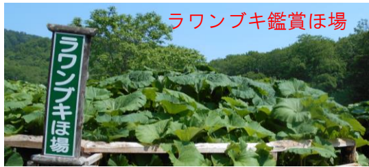
ラワンブキ鑑賞ほ場